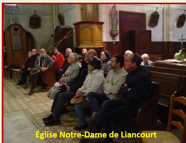
Église Notre-Dame de Liancourt