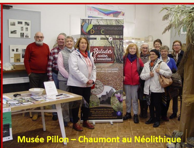
Musée Pillon – Chaumont au Néolithique