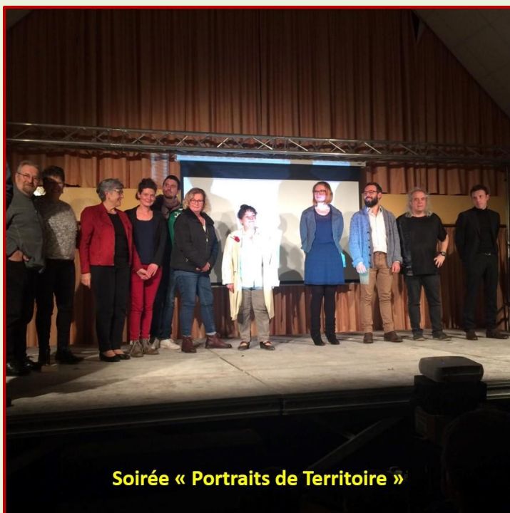
Soirée « Portraits de Territoire »